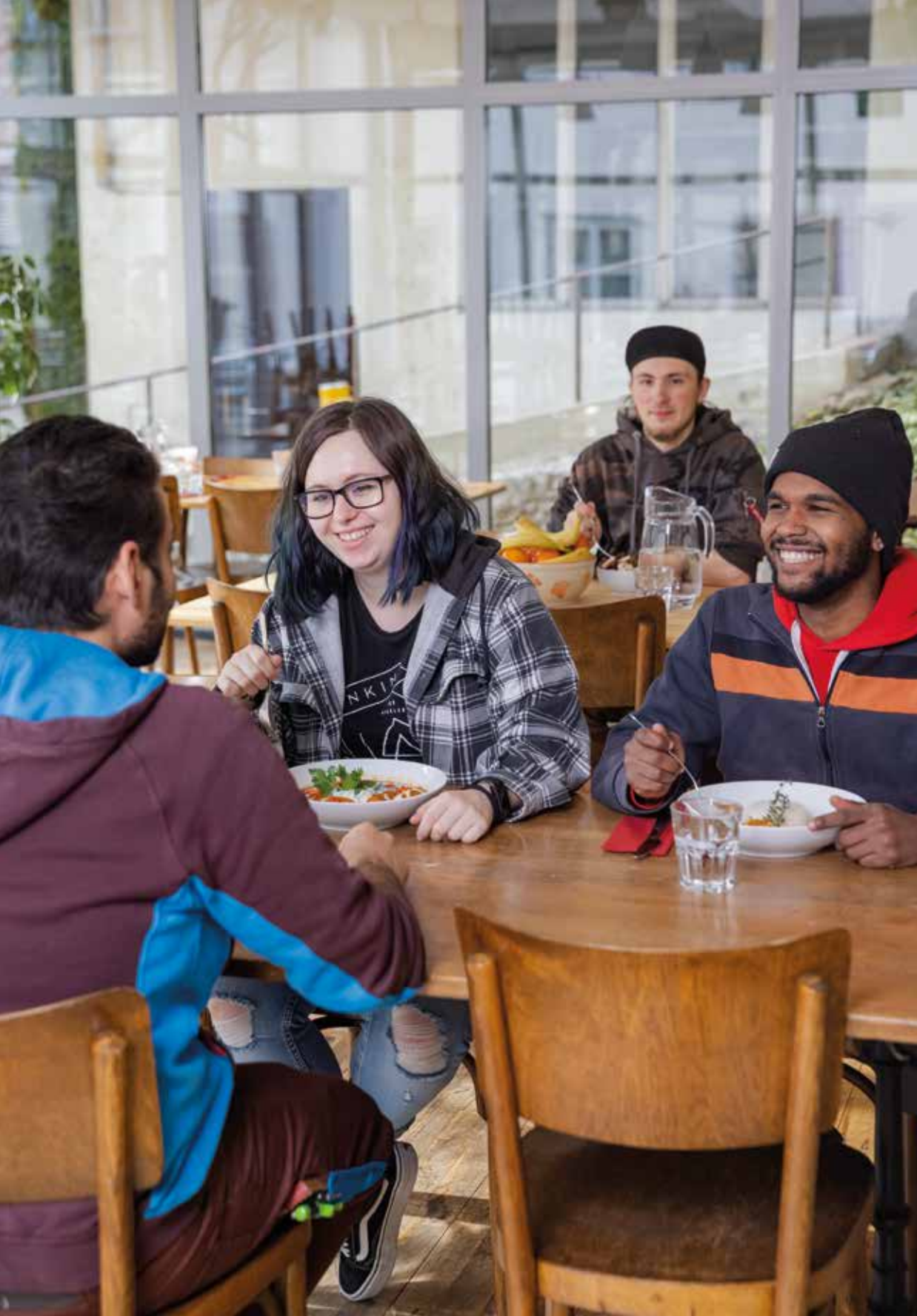
Bild Seite 6/7: Gemeinsames Kochen in unserem Märtplatz- Wohnhaus.